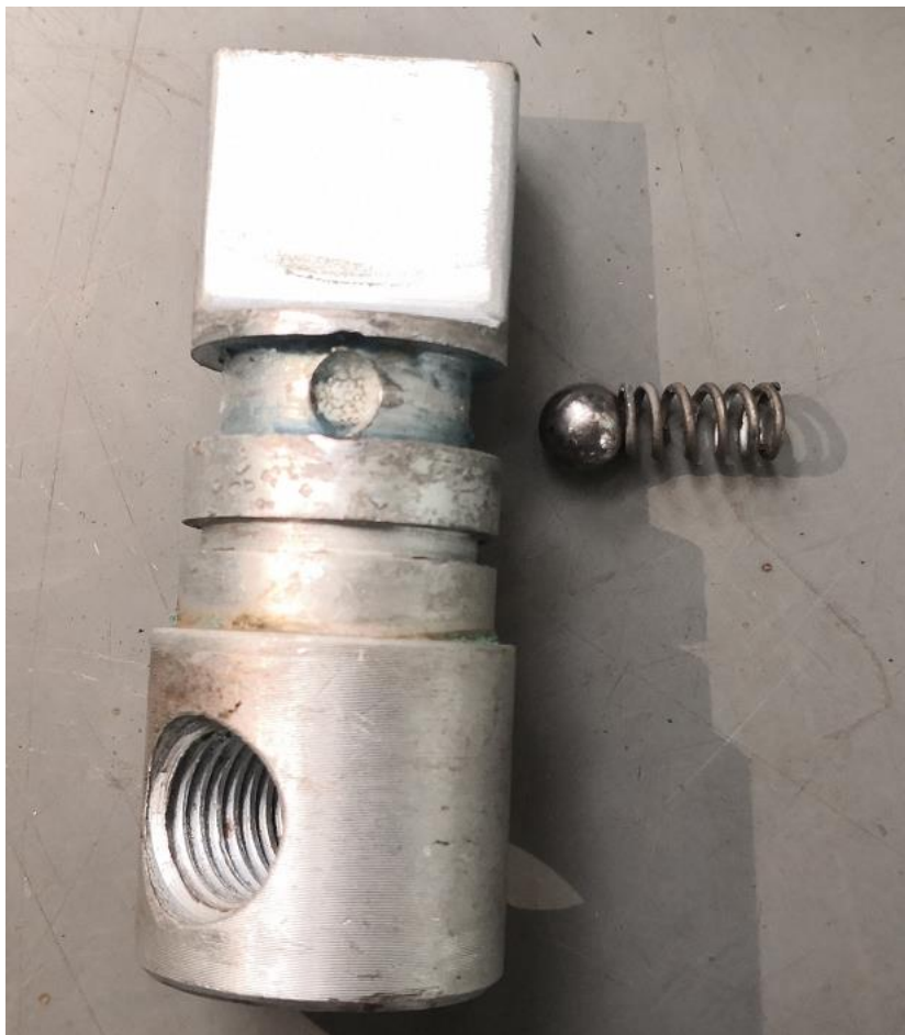
松闸顶杆及定位装置