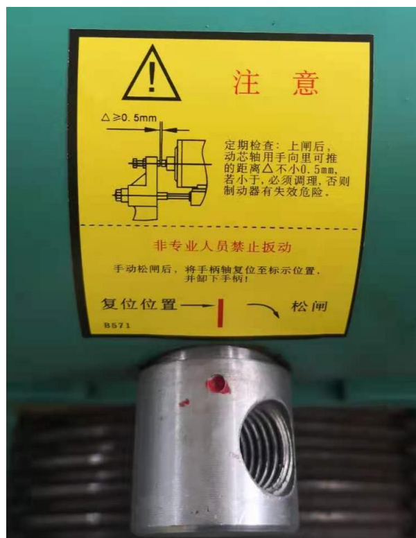
手动松闸装置操作复位说明标签